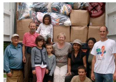
Merci à toute l'équipe pour le remplissage du container !

L'acheminement et le dédouanement de ce matériel ont exigé beaucoup de temps, d'énergie et représentent financièrement une part importante du projet : 5774 € soit 27% des dépenses. L'association n'ayant pas les ressources suffisantes nous avons financé nous-mêmes une grande part de ces dépenses.